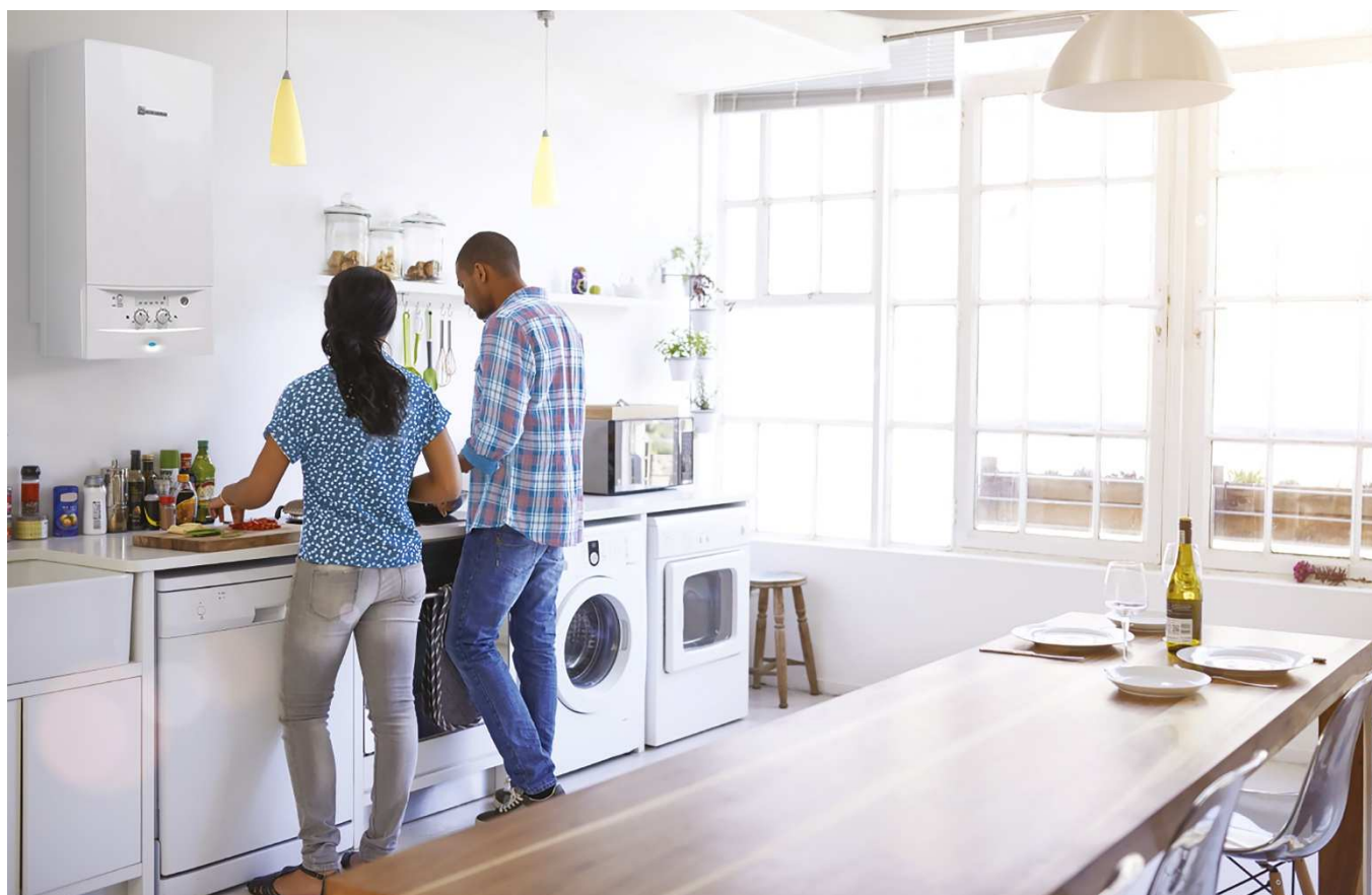
Chaudière murale gaz conventionnelle mixte à micro-accumulation Acléis BAS NOx

La gamme Acléis BAS NOx se décline en deux modèles selon les modes d'évacuation à tirage naturel (NGLM 24-7XN) ou VMC (NGLM 23-8XN5). Mixte à micro-accumulation, elle est idéale pour alimenter à la fois en chauffage et en eau chaude sanitaire un foyer de 3 à 4 habitants. Ces chaudières, classées conventionnelles selon la norme EN 297, diffusent une chaleur douce, propre et économique.