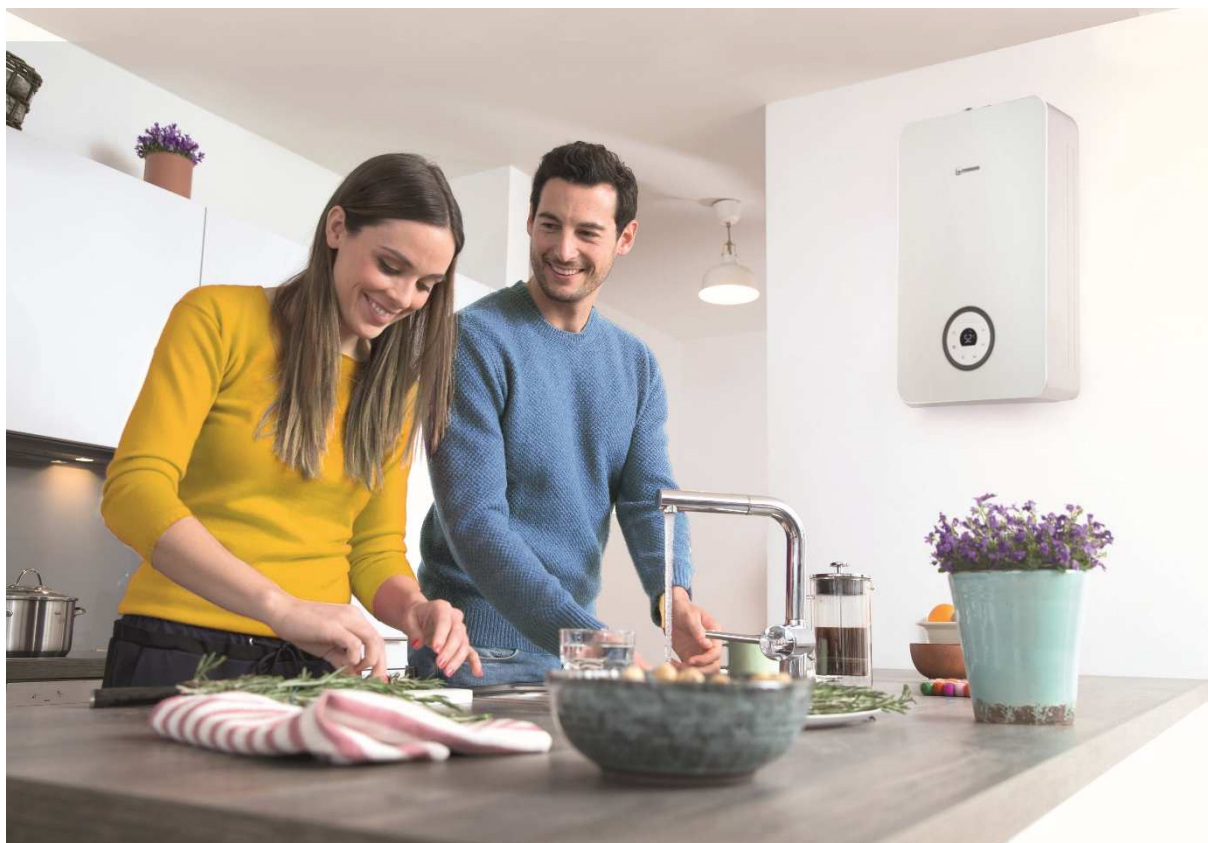
Chauffe-bain gaz ventouse Ondéa HYDROSMART BAS NOx