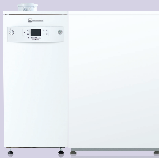
soltis CONDENS avec ballon BIL 120

* Sur le prix de la chaudière posée par un professionnel, hors main-d'œuvre.